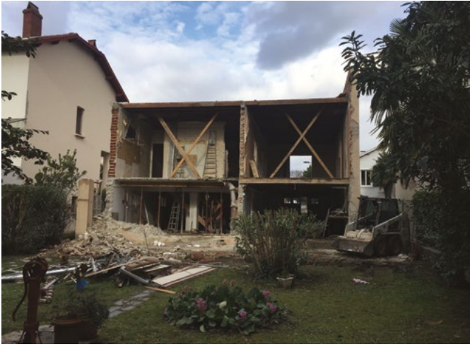
Pendant les travaux, de la façade côté jardin il ne reste rien.