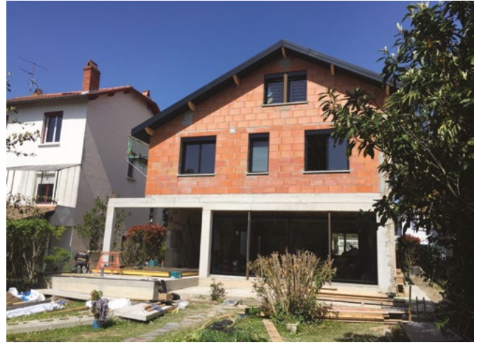
La façade côté jardin en cours de construction. Sur la partie gauche, l'extension en bois parée d'un bardage en zinc noir s'apprête à s'élever sur la dalle. Elle accueillera la cuisine.

« Nous avons tout cassé , prévient l'architecte. Il ne restait que 3 murs. Nous avons remonté les planchers du premier étage d'un mètre, recalibré toutes les ouvertures, construit une nouvelle façade côté jardin, installé les pièces à vivre au rez-de-chaussée, créé une extension pour la cuisine, surélevé le faîtage de 40 cm, inversé les pentes de toiture et aménagé l'ancien grenier. » Rien que ça.