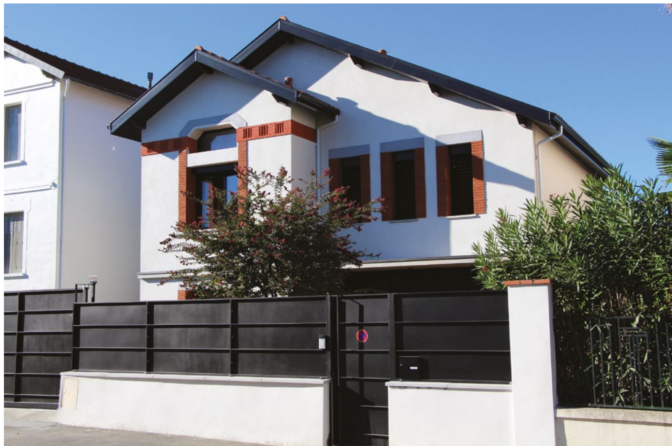
Jeu de couleurs : blanc pur des façades, brique en encadrement et menuiseries en aluminium noir, linteaux gris moyen. Les décorations de façade, côté rue, et la fenêtre trapézoïdale du grenier sont d'origine.