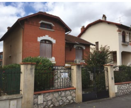
Façade côté rue avant les travaux.