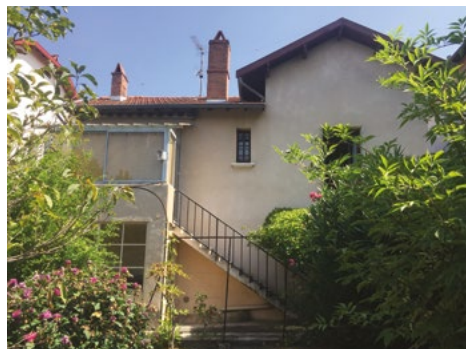
Façade côté jardin avant les travaux.