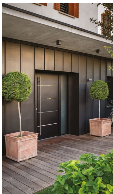
L'entrée de la maison est abritée par une casquette béton de 6 x 1,20 m. Soubassement en zinc noir.